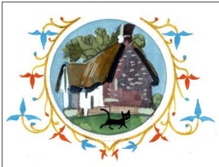
Иллюстрации: Анатолий Иткин.