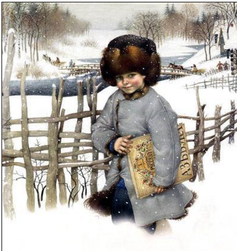
Был мальчик, звали его Филипп.